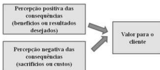
Figura 2 - Valor como resultado das consequências Fonte: WOODRUFF; GARDIAL, 1996, pág. 58.

Outra definição a ser ressaltada é a que propõe Woodruff e Gardial (1996), que destacam que o valor é criado quando o benefício é entregue. Ou seja, os produtos não são os únicos meios para se alcançarem determinados objetivos. Os objetivos do cliente são alcançados também com a entrega das consequências (benefícios) que resultam da experiência completa vivenciada pelo mesmo, e não somente pelas características inerentes ao produto adquirido. Essa relação pode ser observada na Figura 2.